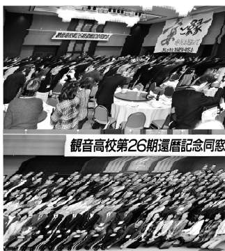
観音高校第26期還暦記念同窓会

た受付カウンターには華やかな雰囲気がいっぱい、艶やかな女性司会者（これも同期生）の軽妙洒落なアナウンスのもとに、その「宴」は始まりました。冒頭に惜しくも一足先に逝かれた同期生たちに黙祷したあと、同窓会長様（代読）や来賓の先生方からご挨拶、厳肅な乾杯とオーブニングセレモニーが進みましたが、そこから先の会場は、一気にヒートアップし、三十余年の時の流れもなんのその、参加者一同、高校在学当時につ飛びです。 カーペンターズのメロディに乗せて、あまりになつかしいスライドショーの後は、クラス対抗「今だから言える当時のヤバイ話」合戦で会場は爆笑の渦に。さらに、入学当時一年生の時のクラス編成に戻っての歓談、当時、流行った歌ベストスリーの合唱とそれに続き、最後に厳か