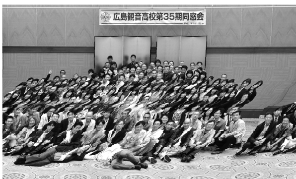
広島観音高校第35期同窓会

芸陽観音同窓会からは、多大なるご協力をいただき創立90周年DVDのなつかしい映像も皆で見ることが出来ありがとうございます。同窓会事務局よりお詫び。2016年の会報にK35同期会報告を掲載しなければならぬところ事務局の不手際、手違いにより掲載できませんでした。心よりお詫び申し上げます。