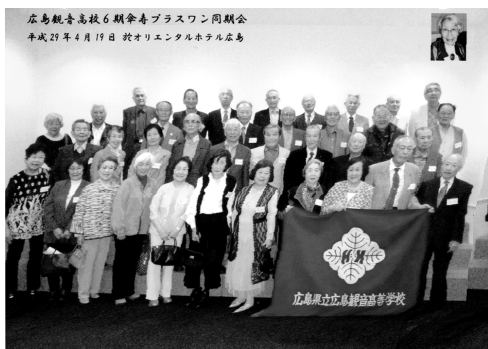
広島観音高校6期傘寿プラスワン同期会 平成29年4月19日 於オリエンタルホテル広島

はと心配したのですが、普通科・ 商業科それぞれに良い協力者を 得、東京・大阪・九州など遠来の友も 多数参加して頂き、直前3名の方 が体調を崩され欠席されましたが、 それでも37名の賑やかな会になり ました。