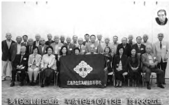
第19回観音四期会 平成19年10月13日 於KKR広島

それでも10月に入り朝夕少しは涼しさを感じる13日（土）第19回四期会総会を33名の参加を得て「KKR広島」にて開催しました。本年は、遠方の人達に配慮し、昼