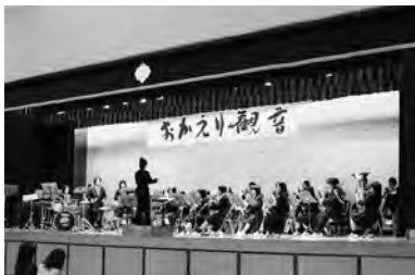
▲観音高校吹奏楽部