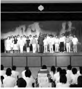
在校生の前で校歌やジュピターを熱唱するOB合唱団

初日は校内公開で、午前中は開行行事の合唱コンクールが行われました。どのクラスも日頃の練習の成果を発揮し、体育館にすばらしい歌声が響きました。OB合唱団による合唱、吹奏楽部演奏もありました。観音大賞には、3年6組の「風になりたい」が選ばれました。 二日目は一般公開で、クラス発表や文化系クラブ・同好会による発表・PTAバザーがあり、それぞれに趣向をこらした取り組みで大盛況でした。閉会行事では学校・PTA主催講演会が行われました。