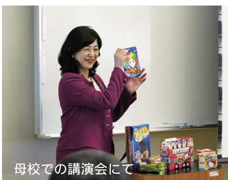
母校での講演会にて

校是「和氣藹然たる間に規律節制あり」を心の支えにし、これからも自然体で、育てて頂いた観音高校のご恩に報いるように精一杯頑張つて参ります。