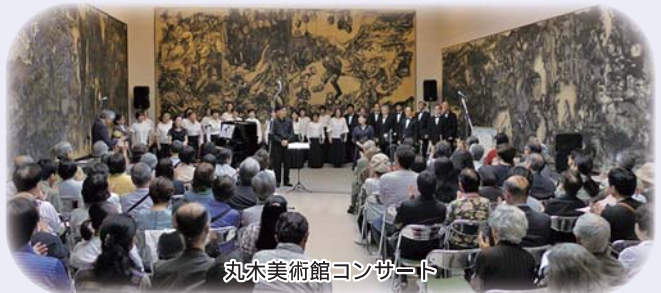
丸木美術館コンサート

・コンサートホールから学校、美術館、寺院などへ、また東京から地方に飛び出して活動の場を広げています。