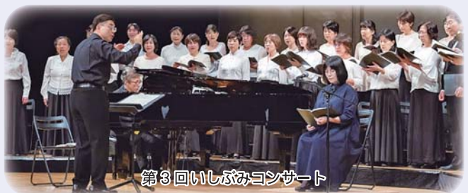
第3回いしづみコンサート