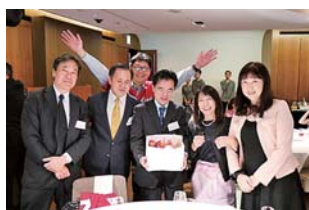
全問正解の31回の皆さん

もう一つは、恒例のカープコーナーでしたが、野球繋がりから過去に軟式野球部が全国大会に出場したことが紹介され、当時の写真が投影されました。