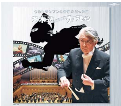
©ユニバーサル ミュージック ©円谷プロ 冬木透 CONDUCTS ウルトラセブン