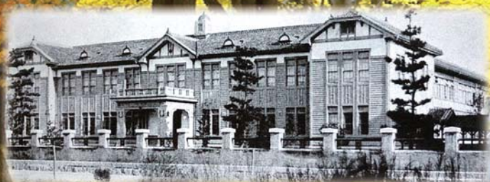
広島県立広島第二中學校