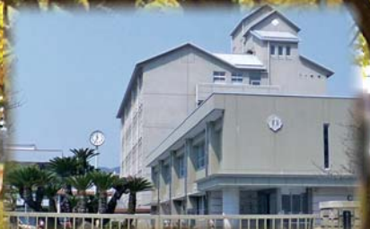
広島県立広島観音高等学校