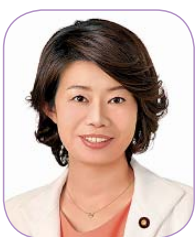
国光 あやの (広島観音 48 回)

在京芸陽観音同窓会の皆様、大変お世話になっております。衆議院議員（茨城6区）つくば、土浦等）の国光あやのです。