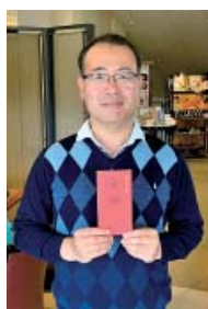
第68回芸陽観音ゴルフ会にて優勝